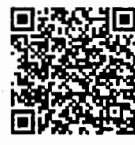
บันทึกการประชุมสภา สำนักrayงาน การประชุมและตัวเลข