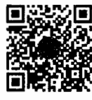
กระตุกถามสด ด้วยวาจา