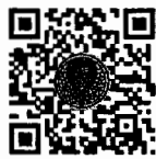
หนังสือนัดประชุม และระเบียบวาระการประชุม สภาผู้แทนราษฎร

รายงานการประชุมสภาผู้แทนราษฎร ชุดที่ ๒๕ ปีที่ ๒ (สมัยสามัญประจำปีครั้งที่สอง) ครั้งที่ ๒๐ เป็นพิเศษ และครั้งที่ ๒๑ ได้วางให้ท่านสมาชิกฯ ตรวจสอบเมื่อวันพฤหัสบดีที่ ๔ พฤศจิกายน ๒๕๖๔ บริเวณหน้าห้องประชุมสภาผู้แทนราษฎร ชั้น ๒ อาคารรัฐสภา ก่อนเสนอให้ที่ประชุมสภาผู้แทนราษฎร รับรอง รวมถึงจัดให้มีข้อมูลในรูปแบบหนังสืออิเล็กทรอนิกส์ เพื่อให้สมาชิกฯ ตรวจสอบดูรายงานการประชุมได้ตามที่ร้องขอ ตามข้อบังคับฯ ข้อ ๓๓ วรรคหนึ่ง ประกอบกับข้อ ๔ ของประกาศสภาผู้แทนราษฎร เรื่อง หลักเกณฑ์และวิธีการขอตรวจดูรายงานการประชุมทางสื่ออิเล็กทรอนิกส์ หรือสื่อเทคโนโลยีสารสนเทศ พ.ศ. ๒๕๖๒